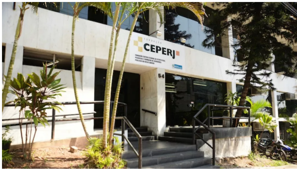
Fachada da sede do Ceperj, em Botafogo, na Zona Sul do Rio

Por O GLOBO — Rio de Janeiro 10/08/2022 07h00 · Atualizado há uma hora